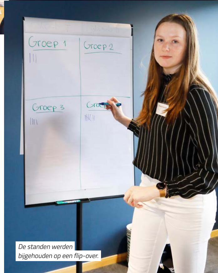
De standen werden bijgehouden op een flip-over.

Via de chatbot Cindy had Syndle deze middag de groep al met meer uitdagingen opgezadeld, met quizvragen bijvoorbeeld. En met het verzoek om duidelijk te maken hoe je een patiënt kunt stimuleren om zo eiwitrijk mogelijk te eten. De chatbot verspreidde voorafgaand aan het evenement informatie over de verschillende onderdelen.