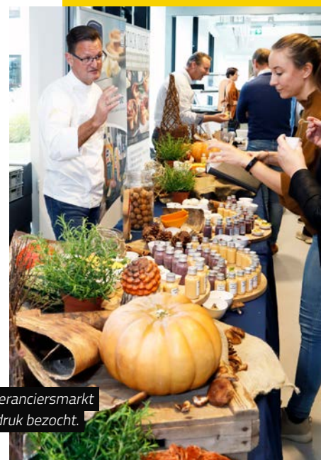
De leveranciersmarkt werd druk bezocht.

Eiwitrijke hapjes, maaltijdwagens, culinaire creaties die je kunt serveren, bijvoorbeeld tijdens een extra eetmoment. In het ziekenhuis of in de zorg. Culicare Catering, Royal Smilde, Unilever Food Solutions en temp-rite (maaltijddistributie) maakten van de leveranciersmarkt een trekpleister tijdens de drie pauzes en na afloop. Het aanbod mocht er zijn: salades per portie, vloeibare vetten, veilige hapjes voor mensen met slikproblemen, eiwitrijke versnaperingen, spreads, soepen en wat al niet meer.