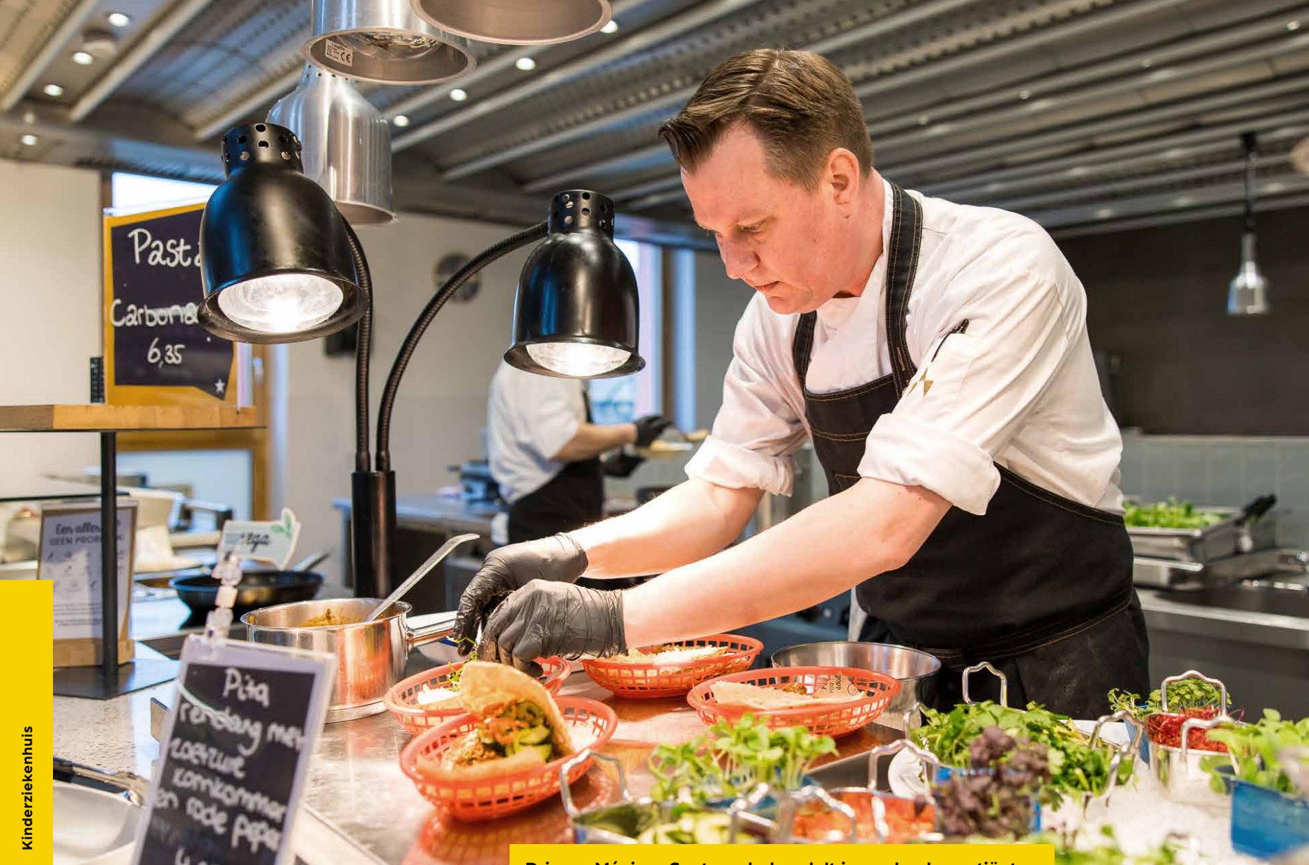
Prinses Máxima Centrum behandelt jonge kankerpatiënten