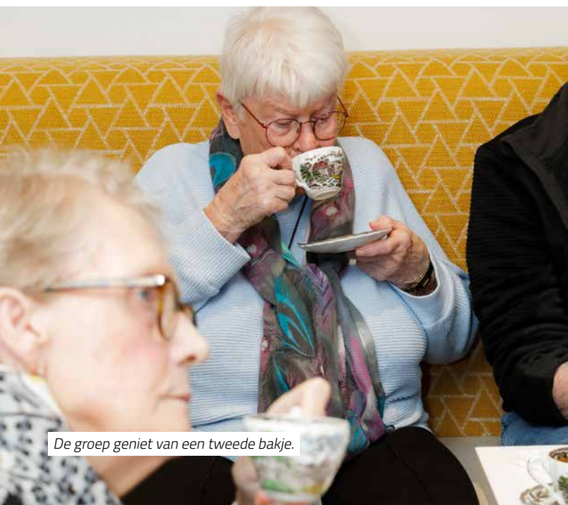
De groep geniet van een tweede bakje.

Om 11.00 uur is de koffie klaar. Vol van smaak, maar niet te sterk. De groep vreesde dat ie wel te sterk zou zijn. Al die scheppen koffie en Buisman en dat zout. Dat kon wel eens te veel van het goede zijn. Maar nee, de koffie is perfect, luidt het oordeel.