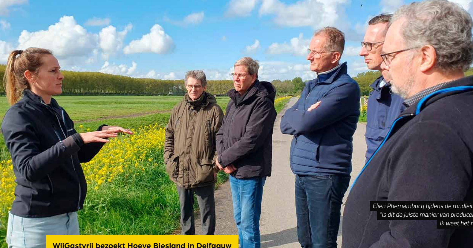
WijGastvrij bezoekt Hoeve Biesland in Delfgauw