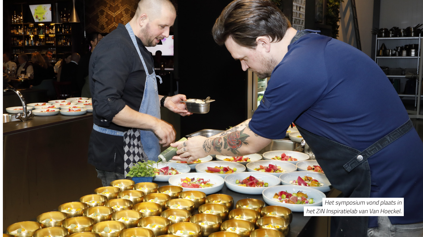
Het symposium vond plaats in het ZIN Inspiratielab van Van Hoeckel.