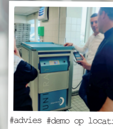
#advies #demo op locatie