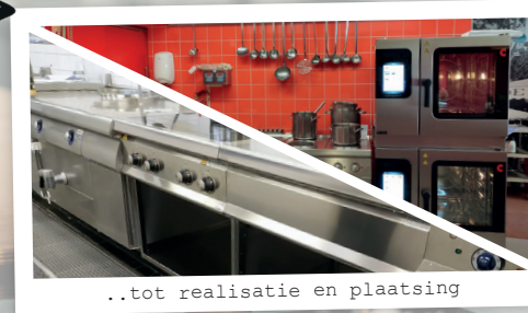
..tot realisatie en plaatsing

temptainer national Rieber BERTO'S devapo SDE Vraag vrijblijvend een demo aan of laat u inspireren door onze gerealiseerde projecten