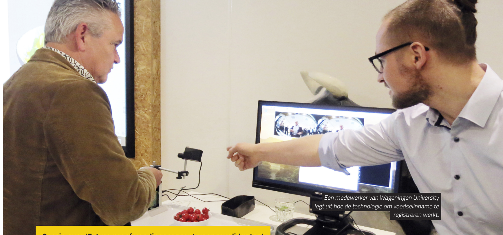
Sessie over 'Future proef voedingsconcept voor revalidanten'