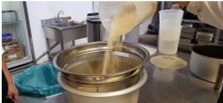
Handelingen sushi rijst: deel 1 wegen, wassen en voorbereiden